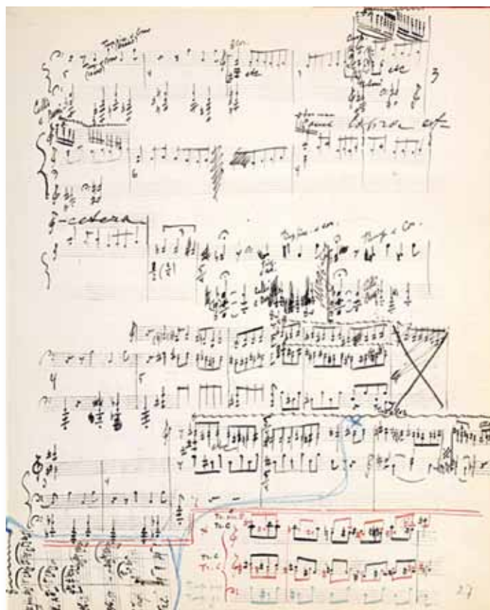
écriture de Messiaen